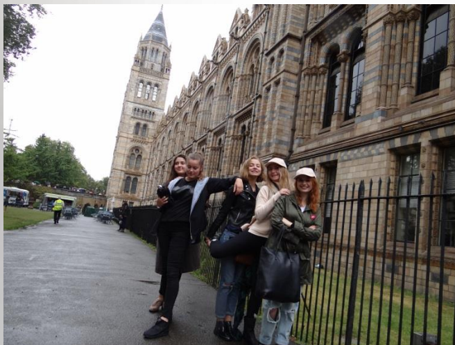
Natural History Museum